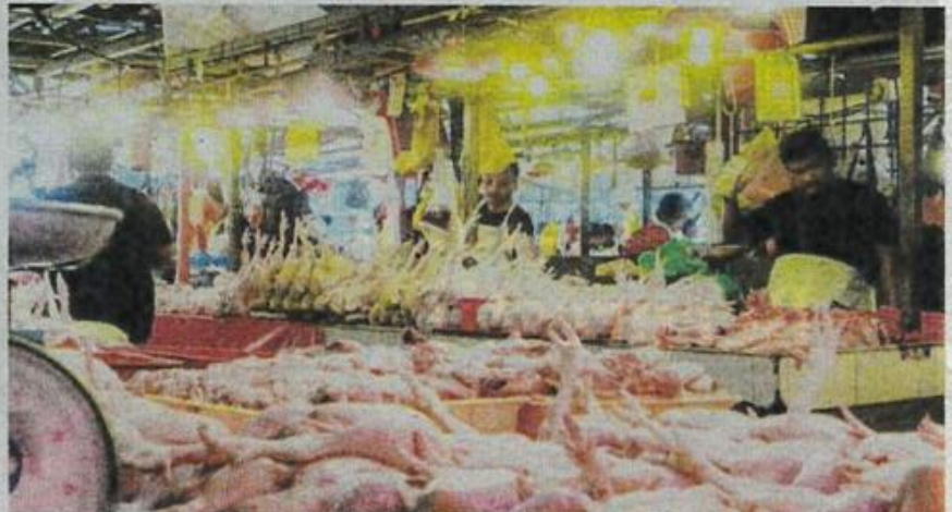
PENIAGA memeriksa tahap kesegaran ayam yang dijual ketika tinjauan harga ayam di Pasar Chow Kit, Kuala Lumpur, semalam.

Manakala di Johor Bahru, harga ayam segar di beberapa pasar di bandar raya ini masih mengekalkan harga siling iaitu RM9.40 sekilogram.