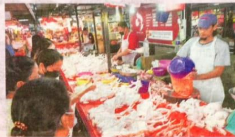
Peniaga menjual ayam ketika tinjauan di pasar basah sekitar Kuala Lumpur.

Beliau berkata, sejak Februari 2022, subsidi telur dan ayam yang sebelum ini hanya diperkenalkan semasa musim perayaan tetapi ia diteruskan dengan