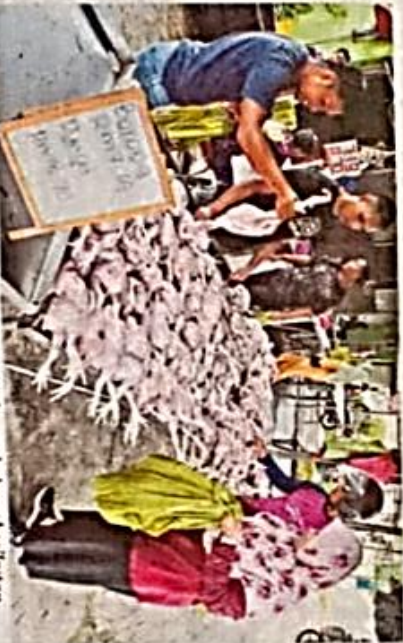
Orang ramai membeli ayam segar pada kadar harga baharu berkaitan subsidi ramai di Gong Peuh, Kuala Terengganu, semalam.