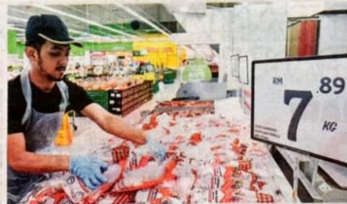
SEORANG pekerja pasar raya di Kuala Terengganu menyusun ayam segar untuk dijual kepada pelanggan pada hari pertama penamatan subsidi dan pengapungan harga bahan mentah itu bermula semalam.